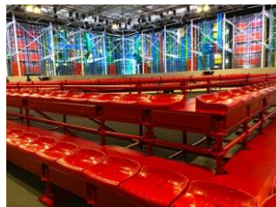
Assises de stade en intérieur et en extérieur