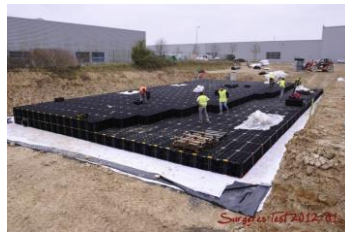
SAUL, exemple de bassin enterré